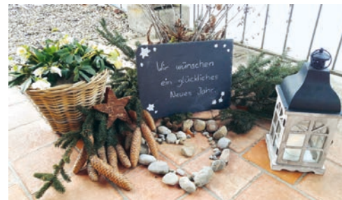
Kirche St. Verena: Silvester/Neujahr