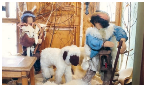
Kirche Bruder Klaus: Hirten unterwegs

Auch die Advents- und Weihnachtszeit forderte und förderte Flexibilität und Kreativität. In vielen Bereichen entfaltete sich Neues und die wenigen Begegnungen waren von spezieller Qualität geprägt. Erfreulicherweise waren wieder viele bereit, Adventsfenster zu gestalten, und unsere Sakristaninnen setzten mit Kreativität wandelnde Blickpunkte in den Kirchen. Je nach Thema konnte man sich mit inspirierenden Texten dazu vertiefen. Wer die Gelegenheit nutzte, bei einer Roratefeier, der Weihnachtsfeier für Kinder oder dem Weihnachtsgottesdienst am Heiligen Abend dabei zu sein, durfte hoffentlich lichtvolle Momente erleben und den Wert der achtsamen Begegnung neu erfahren. Wir sind glücklich über das Engagement von verschiedenen Leuten, die ihre Qualitäten einbringen und das Pfarreileben mitgestalten. «Gemeinsam sind wir Kirche!» Herzlichen Dank an alle, die mit ihrer Tat kraft all diese Anlässe ermöglichten!