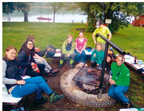
Mini-Weekend am Rhein, Ende Mai