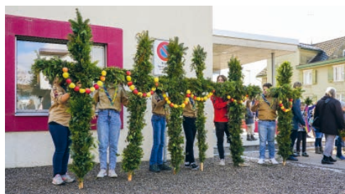
Palmenkreuze von Pfadi und Blauring