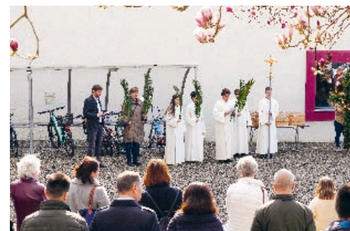
Ministrant*innen und Lektor*innen