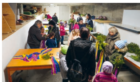
Palmzweige binden mit den Sunntigsfir-Familien