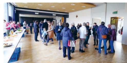
Pfarreiapéro organisiert durch das Team Gemeinschaft mit Unterstützung der Oberministrant*innen