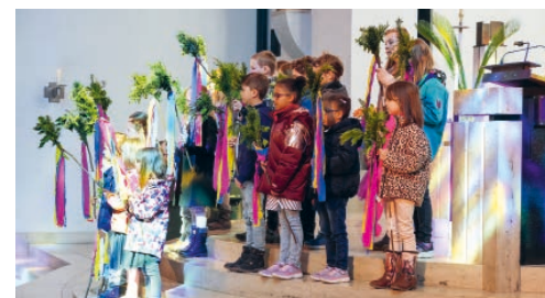
Auftritt der Kinder der Sunntigsfir