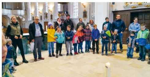
Die Kinder auf dem Versöhnungsweg.

Sonntag, 1. Mai, 10.15 Uhr, Kirche anschliessend sind Sie ganz herzlich zum Apéro eingeladen.