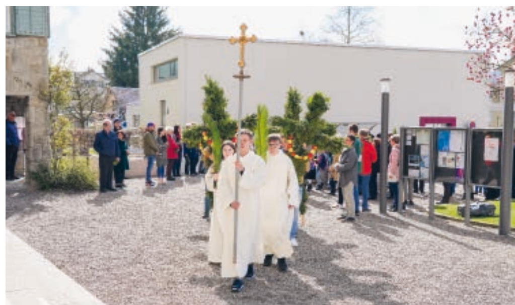
Einzug in die Kirche